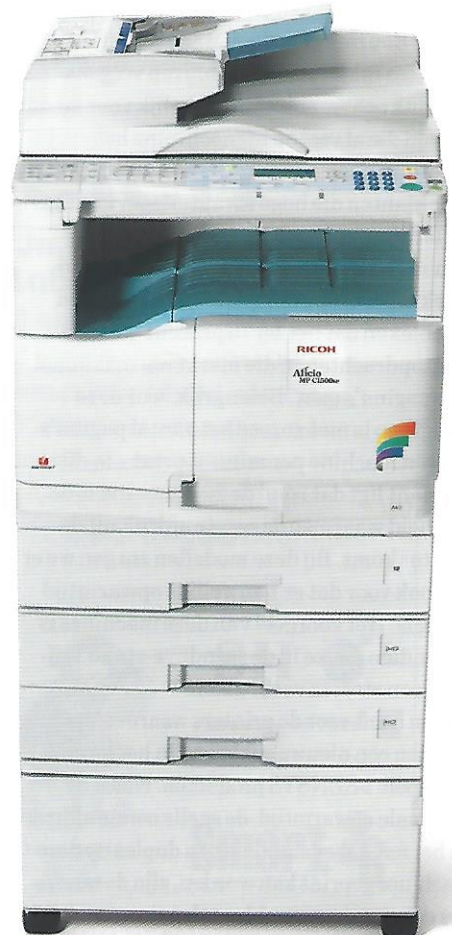
Ricoh MCP 1500 SP

Maar ook de beveiliging van data krijgt veel aandacht bij Sharp, zodat machines door meerdere personen gebruikt kunnen worden zonder te hoeven vrezen dat anderen toegang krijgen tot 'hun' informatie. Gebruikers kunnen zich daartoe via een pincode of wachtwoord identificeren voordat ze een afdruk- of kopieertaak starten, zodat toegang tot gegevens kan worden beperkt. De taak kan alleen na het invoeren van de pincode of het wachtwoord worden uitgevoerd.